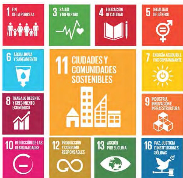
Objectius de l'Agenda 2030 presos en consideració per l'Agenda Urbana de Catalunya.

Està integrada per representants de tots els departaments de la Generalitat, dels ajuntaments, diputacions i entitats municipalistes, així com per membres del teixit associatiu ciutadà i del sector productiu. Per desenvolupar la tasca encomanada, l'Assemblea constituirà els