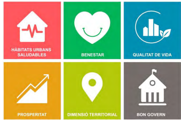
Sis pilars temàtics, 18 objectius i 58 àmbits d'actuacions

grups de treball temàtics adients per analitzar i concretar els objectius que hagi de recollir l'Agenda Urbana. Així mateix, és l'encarregada de designar els experts dels grups de treball i validar-ne les seves conclusions i propostes.