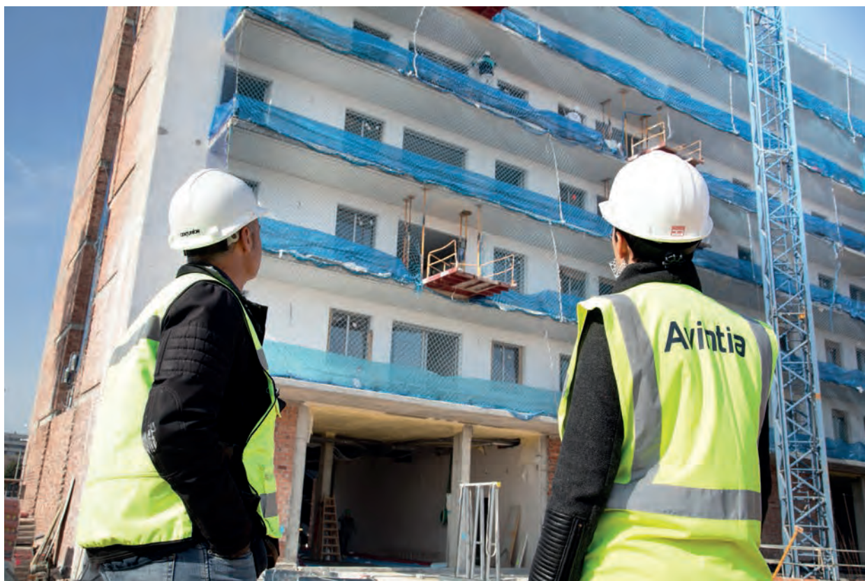
Dos arquitectes tècnics fan el seguiment de l'execució d'una obra

Carles Cartañá