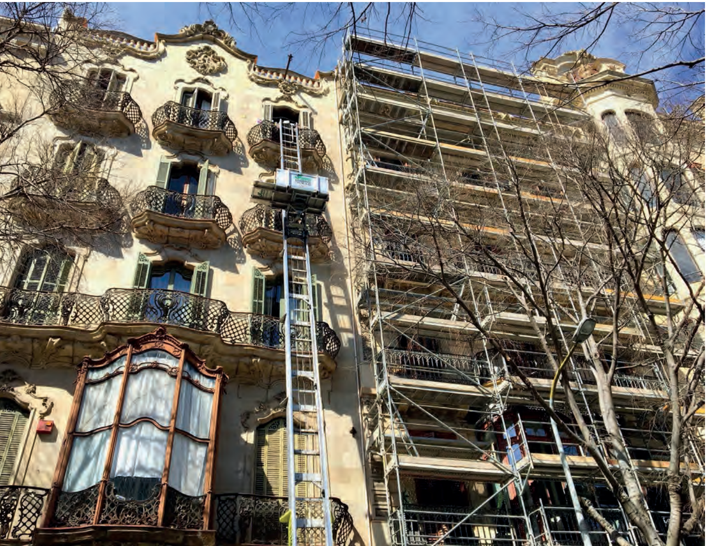
Obres de rehabilitació a Barcelona

residencial de gamma alta escasseja, la qual cosa explica l'acceleració en la posada en marxa de nous projectes que s'ha vingut produint en els dos últims anys. En aquest subsector es preveuen avanços del 6% en 2019, i entorn al 4% en 2020 i 2021.