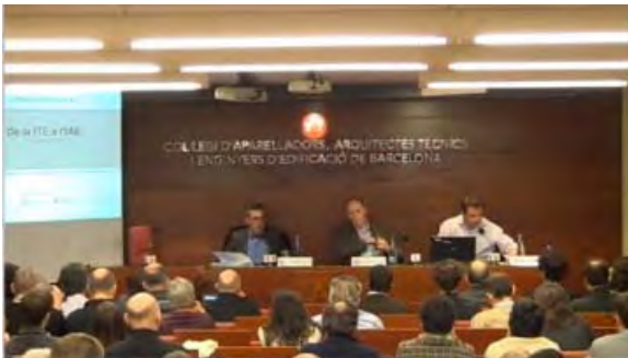
JORNADA TÈCNICA CELEBRADA AL CAATEEB

El passat 11 de març el CAATEEB va organitzar la jornada tècnica de consultes, De la ITE a l'IEE , en què, la Direcció de Qualitat de l'Edificació i Rehabilitació de l'Habitatge de l'Agència de l'Habitatge de Catalunya, el Instituto de la Construcción de Castilla y León (ICCL) i l'Àrea Tècnica del CAATEEB, conjuntament, van fer una presentació i valoració de la situació actual de la legislació estatal i de la legislació autonòmica que fa referència a les inspeccions tècniques que els edificis residencials d'habitatges estan obligats a complir. L'assistència va ser força nombrosa, amb més de 120 col·legiats i la van seguir per streaming 200 persones interessades més, aproximadament.