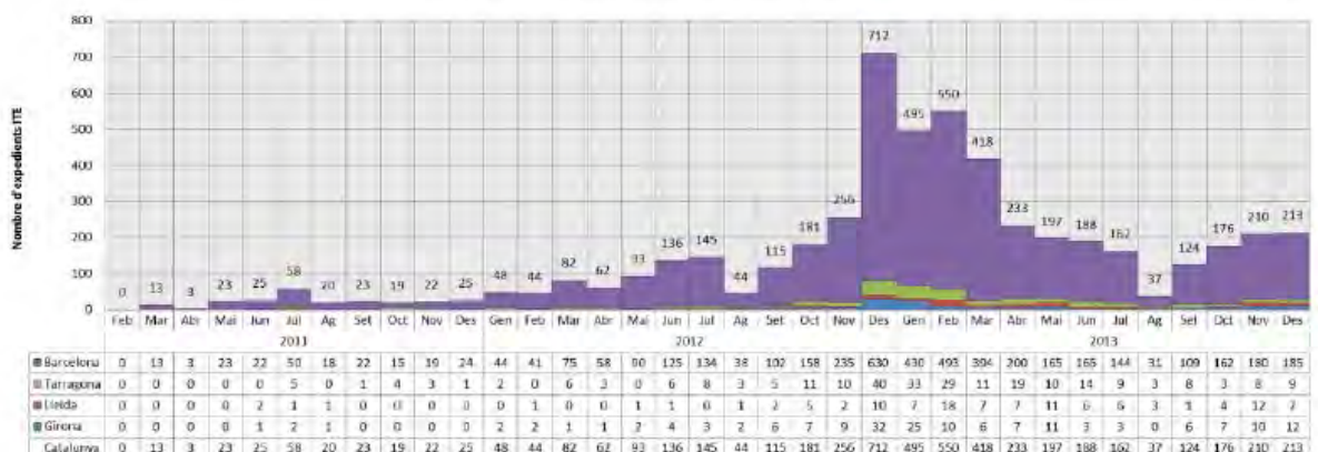
EXPEDIENTS D'ITEs MENSUALS PRESENTATS A LA GENERALITAT DE CATALUNYA DES DEL 26-02-2011 AL 31-12-2013