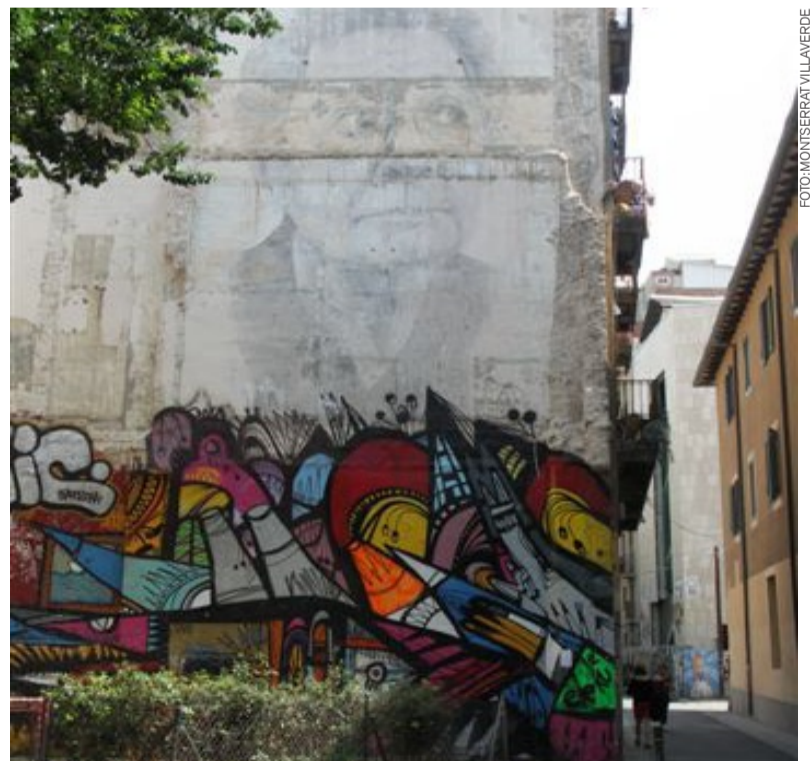
ELS ESTUDIS HISTÒRICS TAMBÉ VERSEN SOBRE LA CONTEMPORANEÏTAT I LES CONCRECIÓNS EFÍMERES. BARCELONA