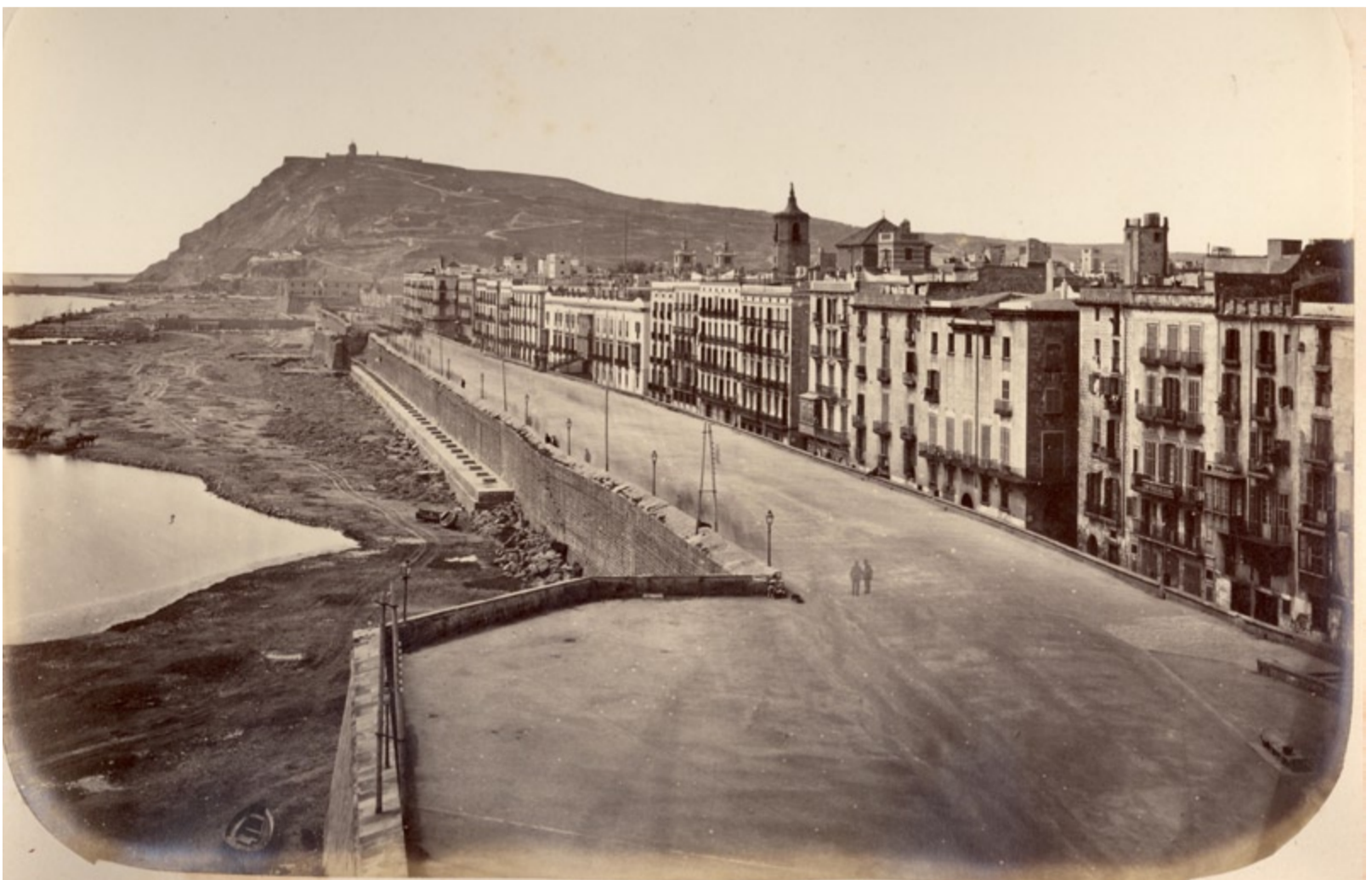
EL PASSEIG DE LA MURALLA DE MAR DE BARCELONA, FOTOGRAFIADA PER MARTÍ I EDITADA EL 1874 EN EL ÀLBUM BELLEZAS DE BARCELONA . COL·LECCIÓ PARTICULAR

Reflexions a l'entorn dels estudis previs al projecte de rehabilitació