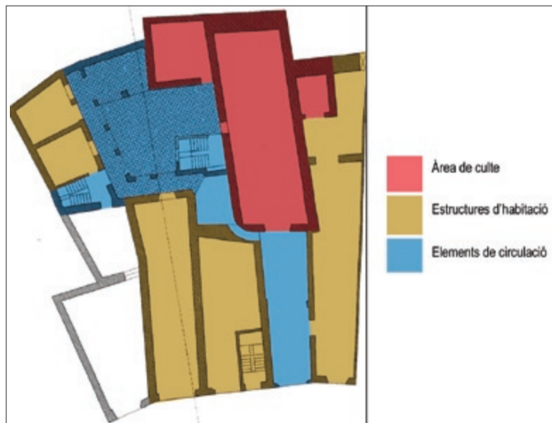
ELS DIFERENTS USOS I TIPOLOGIES D'ESPACIS FACILITEN EL CONEIXEMENT DE LES ESTRUCTURES. HOSPITAL DE CLERGUES DE SANT SEVER. ÀQABABCN

Els documents són la part essencial d'un estudi històric. Document és el propi edifici o l'àmbit urbà que s'ha d'estudiar; els indrets de la pròpia experiència. Però en el sentit més estricte, els documents utilitzats en els estudis històrics són de tipologia àmplia i variable, depenent bàsicament del moment cronològic que ens interressi documentar 5 . Registres cadastrals, d'hisenda, autoritzacions