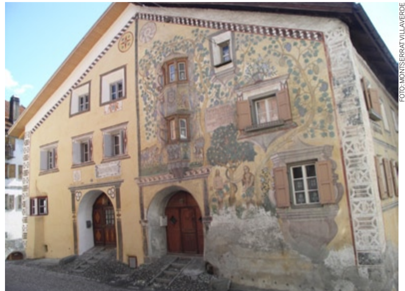
LA LECTURA SIMBÒLICA DE MOLTS ELEMENTS DELS EDIFICIS TAMBÉ ÉS OBJECTE D'ESTUDI. ARDEZ (SUÏSSA)