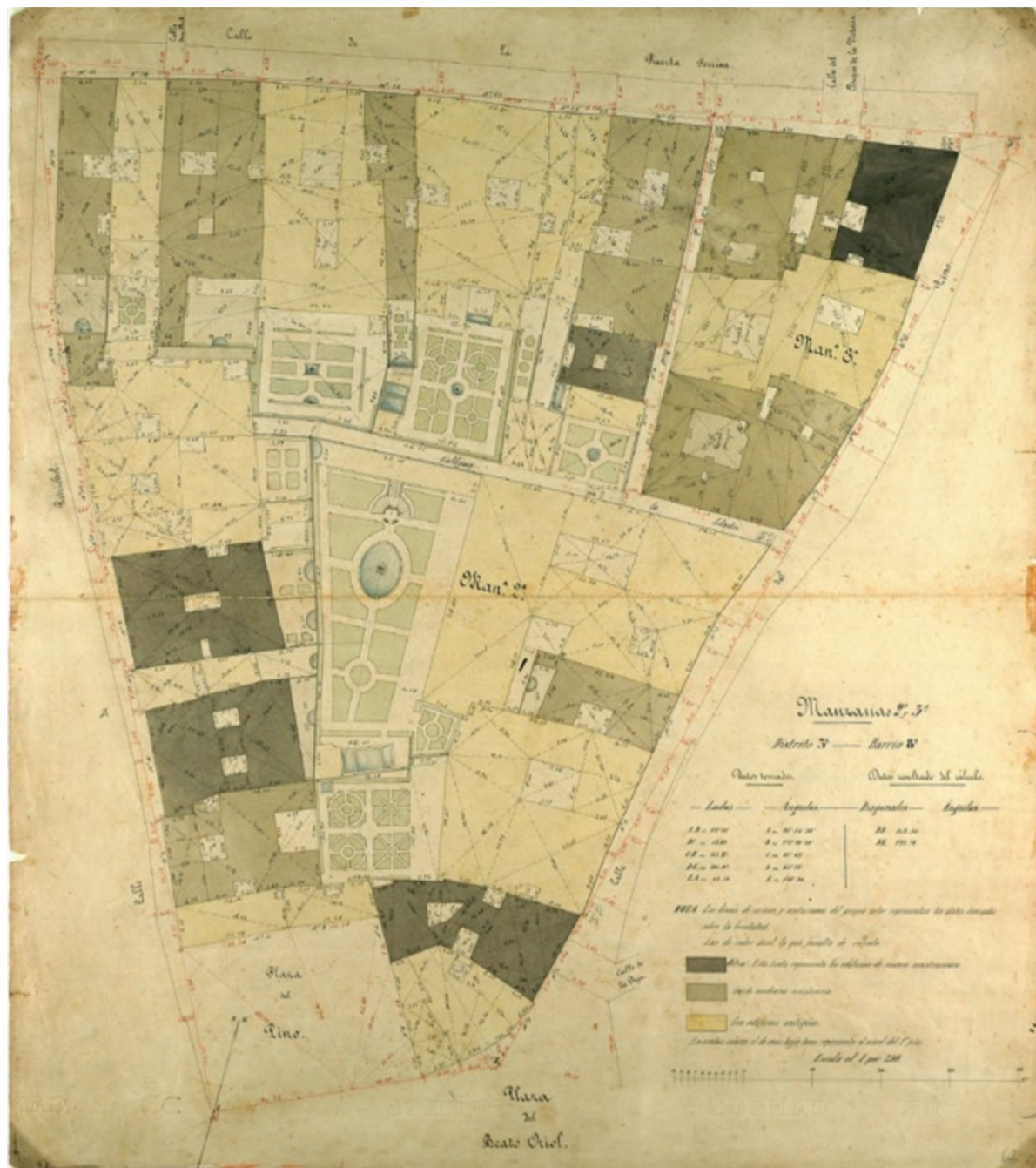
ELS QUARTERONS D'EN GARRIGA I ROCA, SEGUEIXEN SENT DOCUMENTS IMPRESCINDIBLES EN L'ESTUDI DE LA CIUTAT DE BARCELONA. LA PRECISIÓ EN CADASCUNA DE LES PARCEL·LES AIXÍ COM EN EL DISSENY ACURAT DELS JARDINS EL FAN UN DOCUMENT EXCEPCIONAL. 1856.AHCB

Però l'estudi històric va aportar en aquest cas, quelcom més important, i és la constatació de que cadascuna de les finques, a través dels diferents acabats dels paraments (elements no regulats des de l'Ajuntament) va individualitzar i fomentar la diferenciació entre elles. I aquestes factors, intrínsecs a la història de cada finca, formen part del concepte d'endocontext. En aquests moments, si un passeja per la Rambla, a l'alçada de