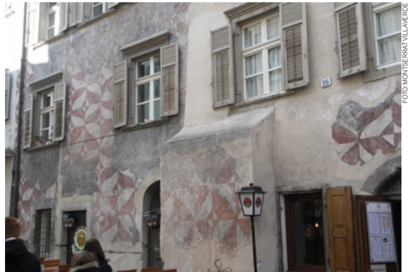
L'EDIFICI ÉS PER SE UN DOCUMENT ÚNIC QUE CAL LLEGIR I INTERPRETAR DE FORMA CONTEXTUALITZADA. BOLZANO (ITÀLIA)